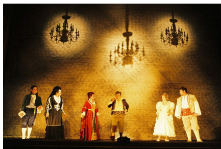
Scenă din final