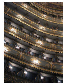
The Estates Theatre (interior)

„Don Giovanni” în sanctuarul mozartian de la Praga a fost un spectacol care, prin montare și pregătire muzicală, prin vocea interpretului rolului titular – în primul rând - a omagiat cum se cuvine celebritatea astrului salzburghez. Rămân cu această impresie și cu cea a perpetuării în timp a spiritului donjuanesc întrucât, în viziunea regizorului Václav Kašlík, neînfricatul erou apare în momentul când, la sextetul final, toți se bucură și își expun planurile de viitor. Chiar dacă Don